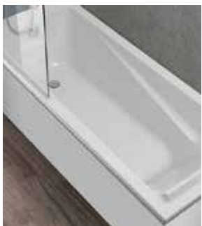
Bañera Easy Roca