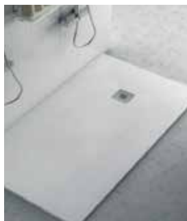
Plato de Ducha Resina Pizarra Blanca