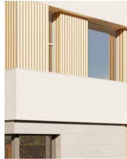
Revestimiento Piedra y Gres