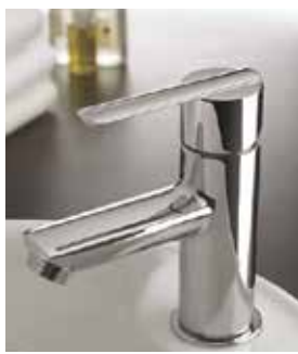
Grifería Lex de Tres