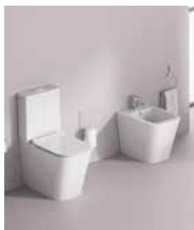
Inodoro y Bidet Florencia Fossil Natura