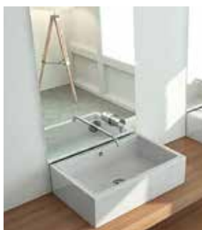
Lavabo Duna de Fossil Natura