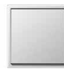
Mecanismo Jung LS 990