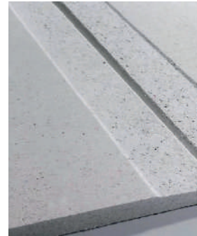
Placa de yeso