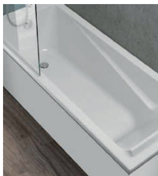
Bañera easy Roca