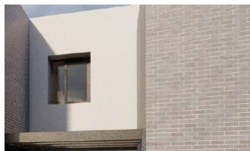
Revestimiento ladrillo y monocapa