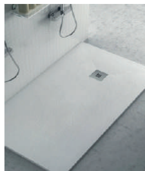
Plato de ducha resina pizarra blanca