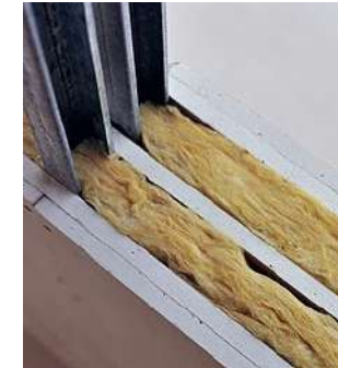
Tabiques tipo pladur