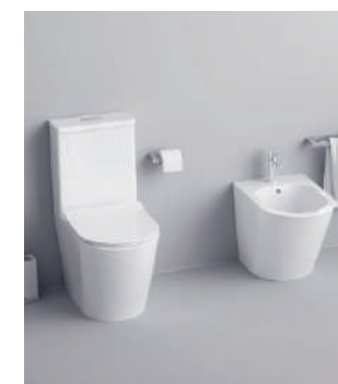
Inodoro y Bidet Florencia Fossil Natura