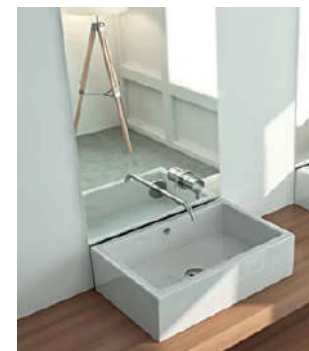
Lavabo Duna de Fossil Natura