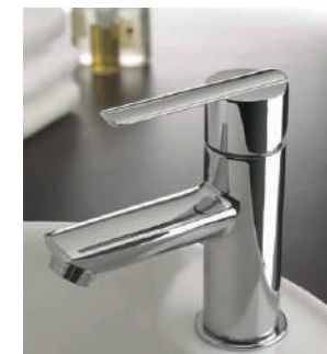
Grifería Lex Tres