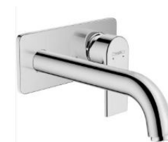
Grifería Monomando cromo hansgrohe o similar