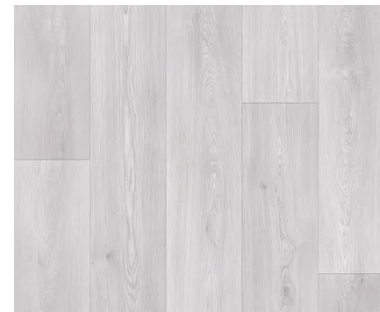
Solado tono gris