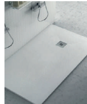
Plato de ducha resina/cerámica blanca