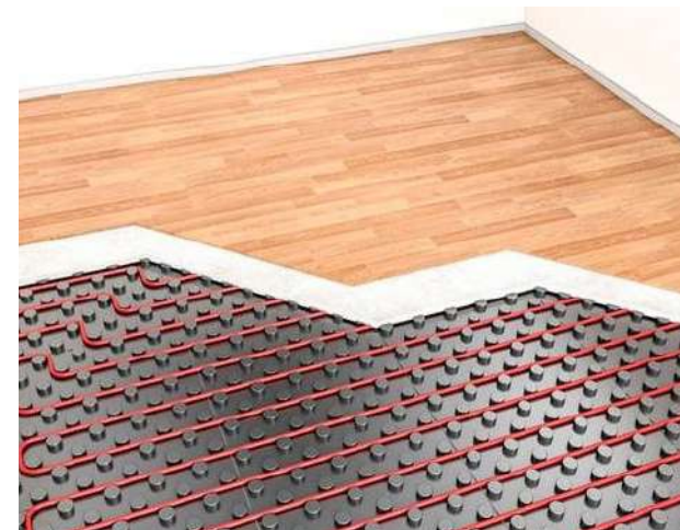
Suelo radiante y refrigerante