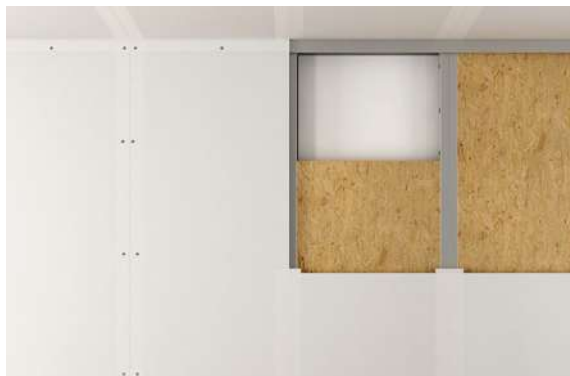
Tabiques tipo pladur