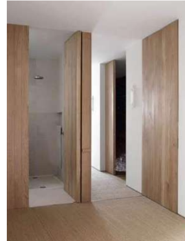
Puerta color madera

* Las puertas de armario irán en el mismo modelo que las puertas de paso elegidas.