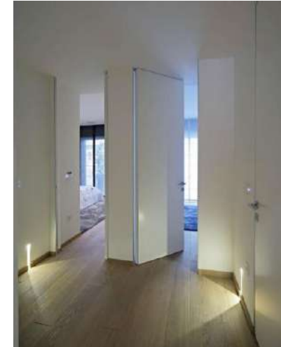
Puerta lacada blanco