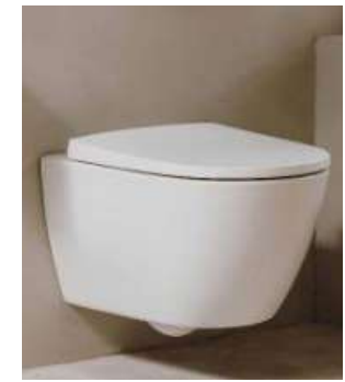
Inodoro suspendido Roca