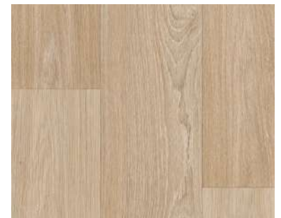
Solado tono madera