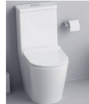
Inodoro Roca o similar