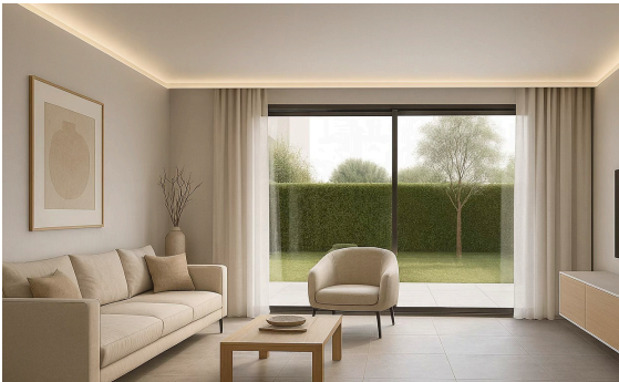
Foseados con luz indirecta