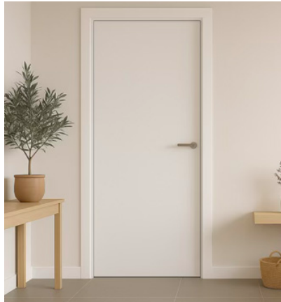
Puertas de paso